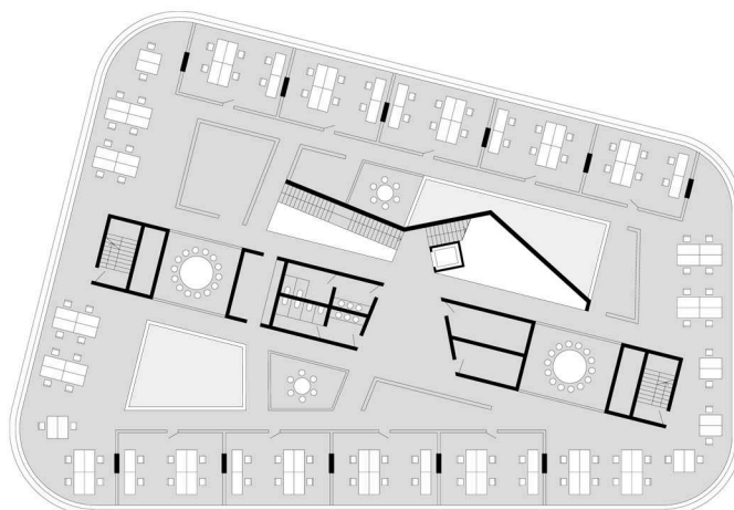
+ půdorys patra